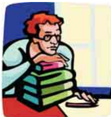
Ocena dowodów należy do zespołu arbitrów

W praktyce chodzi najczęściej o dowód z dokumentów składających się na dokumentację postępowania o zamówienie przedstawianą przez zamawiającego, jak również z innych dokumentów wnioskowanych przez strony (zwłaszcza przez odwołującego się wykonawcę) na rozprawie. Rzadziej są wnioskowane dowody: z zeznań (w powołanym przepisie użyto określenia „wyjaśnień”) świadków, z opinii (a także z zeznań) biegłych; nie korzysta się z dowodu z przesłuchania stron (w rozumieniu art. 304 k.p.c.). Z dowodem „z zeznań stron” nie należy mylić instytucji tzw. informacyjnego przesłuchania stron , jego celem jest bowiem tylko wyjaśnienie i uzupełnienie ich twierdzeń.