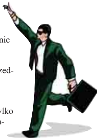
Zespół arbitrów może wyrokiem oddalić albo uwzględnić odwołanie

Unieważnienie oprotestowanej czynności zamawiającego następuje w razie stwierdzenia, że została ona dokonana z naruszeniem prawa (przepisów p.z.p. i aktów wykonawczych do tej ustawy lub przepisów innych aktów prawnych). W praktyce dopuszcza się unieważnienie także innych, niż oprotestowana czynności zamawiającego. W kwestii nieważności czynności zamawiającego dokonanej w postępowaniu o udzielenie zamówienia publicznego stosuje się przepisy k.c. o nieważności czynności prawnej, w szczególności przepis art. 58 ust.1 (w związku z art. 14 p.z.p.).