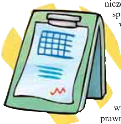
Termin do wniesienia protestu jest terminem zawitym

Przepis art. 180 ust. 2 reguluje też drugą ważną kwestię – utrzymuje dotychczasowe rozwiązanie, według którego protest (treść protestu) uważa się za wniesiony z chwilą, gdy doszedł on do zamawiającego, w taki sposób, że mógł się on zapoznać z jego treścią. Wykorzystano tu konstrukcję prawną przyjętą w prawie cywilnym (art. 61 k.c.) dla oświadczenia woli, które ma być złożone innej osobie (jest złożone