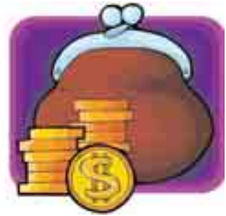
Strony ponoszą koszty postępowania odwoławczego stosownie do jego wyniku

Naruszeniem zasady odpowiedzialności za wynik postępowania byłoby oddalenie odwołania i obciążenie zamawiającego kosztami postępowania czy uwzględnienie odwołania i obciążenie kosztami postępowania odwołującego się.